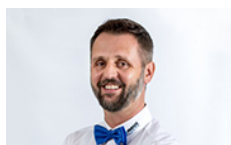
Verkaufsberater VW Neuwagen