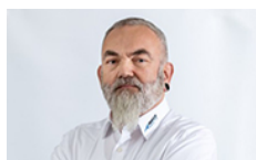
Verkaufsberater VW Neuwagen